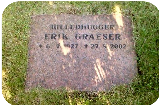
Veksø Kirkegård, Veksø Sj. (2007)