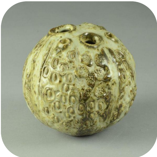
Hulvase fra Jørgen Mogensen (signeret JM)