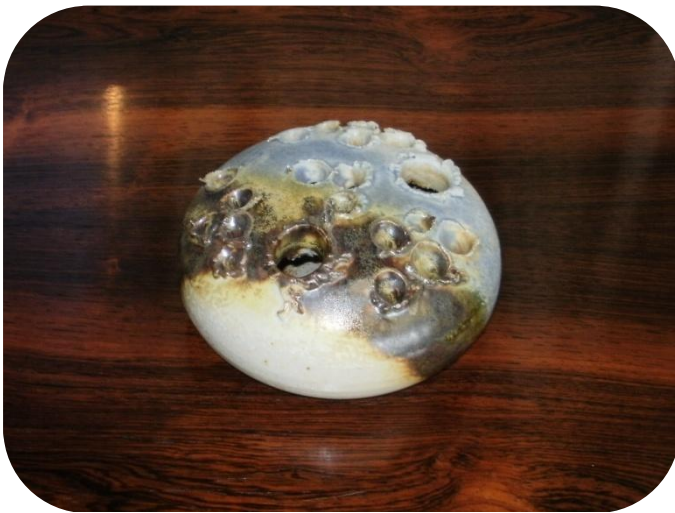
Blomstersten fra Aage Würtz, Hatting