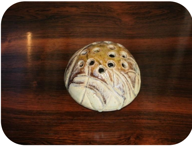
Flerhulsvase med AF signatur