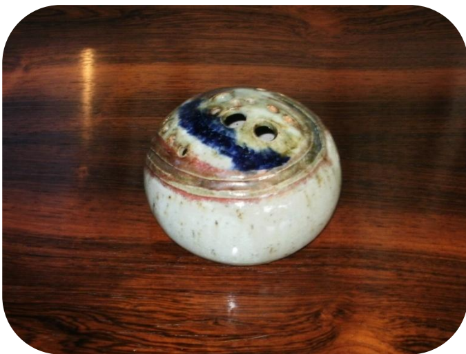
Flerhulsvase med Christiansfeld mærke