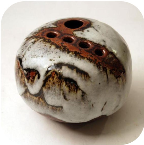
Hulvase fra Jørgen Mogensen (signeret JM)