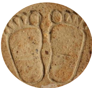
Signatur fundet på brugskunst fra Erik Graeser