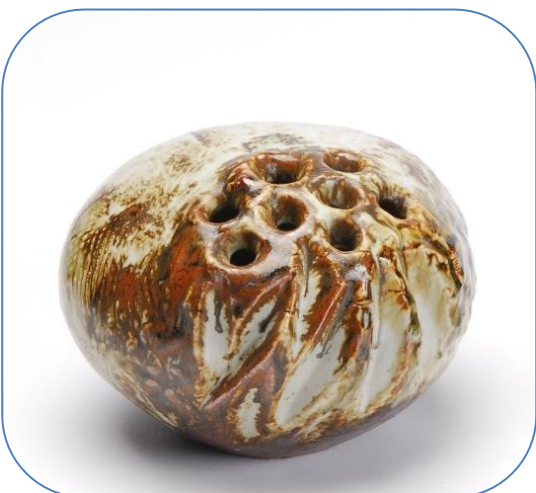
Hulvase fra Jørgen Mogensen (signeret JM)